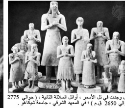
تمثال وجدت في تل العمار ، أوائل السلالة الثانية ، (حوالي 2775 - حوالي 2650 ق.م) في المعهد الشرقي ، جامعة شيكاغو .

وقد جمع إبراهيم بن محمد آل الشيخ بين رئاسة إدارات البحوث العلمية والإفتاء والدعوة، ورئاسة اللجنة الدائمة للبحوث العلمية والإفتاء إلى أواخر سنة 1395 هـ / 1975 م، حيث تم تعيينه وزيراً للعدل ، إلا أنه سيحتفظ بعضويته في هيئة كبار العلماء 18 .